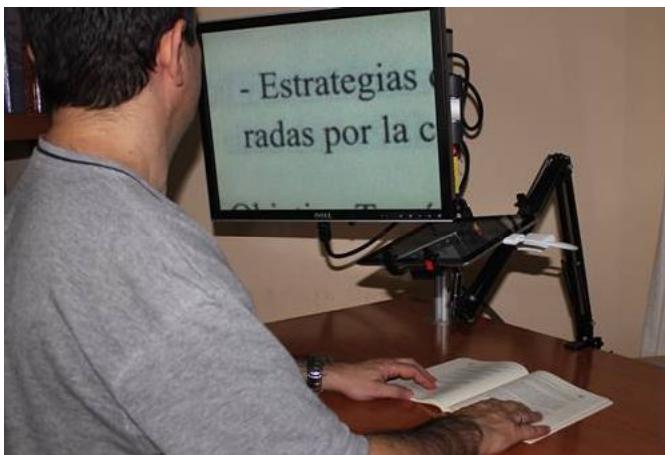
Persona magnificando el contenido de un libro en la pantalla del ordenador para verlo mejor

Para aquellos estudiantes que poseen resto visual aprovechable y utilizan el sistema de lectura en tinta, pero tienen dificultades para acceder a la información de la pantalla del ordenador trabajando a una distancia normal y necesitan acercarse continuamente al monitor para leer la información, se pueden usar los magnificadores de pantalla. Estos son aplicaciones que permiten la ampliación de una zona de la pantalla del ordenador, mostrando los elementos que aparecen en ella aumentados de tamaño.