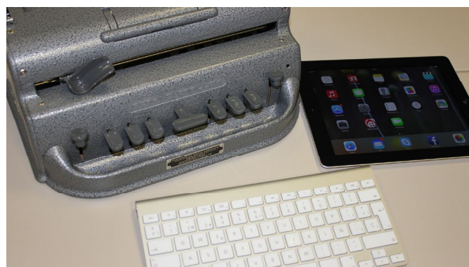
Máquina Perkins al lado de una tableta y un teclado

ñal auditiva eliminando los efectos negativos que la distancia, el ruido y la reverberación tienen sobre la calidad del mensaje oral. Estos productos de apoyo permiten que los estudiantes usuarios de prótesis auditivas perciban con una mayor inteligibilidad el mensaje transmitido por el profesor, incluso cuando éste se mueve por la clase mientras explica. El sistema de frecuencia modulada (FM) está formado por un emisor que lleva el profesor y un receptor que lleva el estudiante conectado. El Bucle magnético recoge la voz del profesor a través de un micrófono y la transmite a través de ondas magnéticas, mediante un aro o bucle magnético a la prótesis auditiva del alumno. Ello permite también que el estudiante reciba los comentarios de sus compañeros.