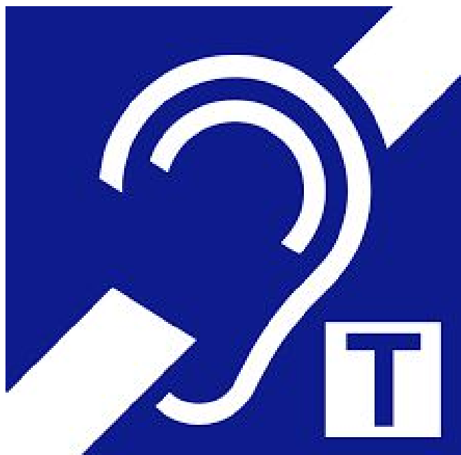
Símbolo internacional del uso de bucle magnético

También existe material informático que trabaja aspectos relacionados con el sonido y la reeducación de la voz, que incluye aspectos gramaticales, de vocabulario y lectura a través de juegos, programas de simulación y ejercitación, o programas que realizan la representación gráfica de la voz a partir del sonido o señal acústica a través del micrófono. Este material puede servir de ayuda en cualquier situación en la que se encuentre la persona con problemas de audición.