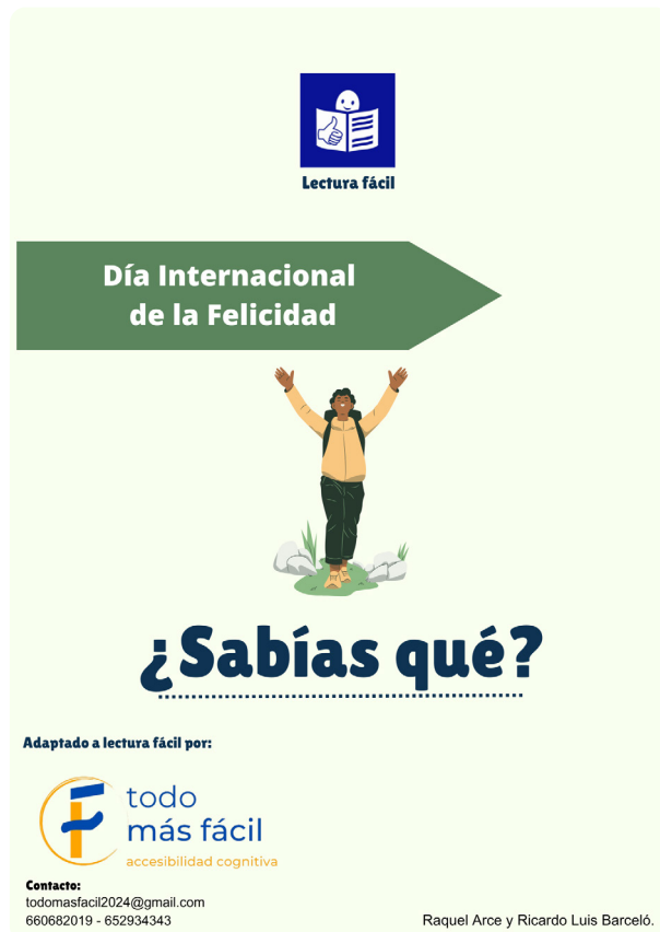
Imagen 1: Portada del «¿Sabías qué?» dedicado al Día Internacional de la Felicidad.

Nuestra inquietud intelectual y la buena acogida que han tenido las publicaciones, nos ha animado a empezar a preparar series sobre temas de salud, sobre deportes y otros temas que irán surgiendo.