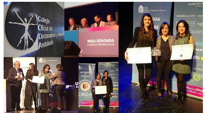
Algunos instantes de la ceremonia de entrega de premios "CODA PHI Hotel" en Málaga

ASEPAU se va consolidando así, como un referente a la hora de tener presente la Accesibilidad en los trabajos de nuestros futuros profesionales.