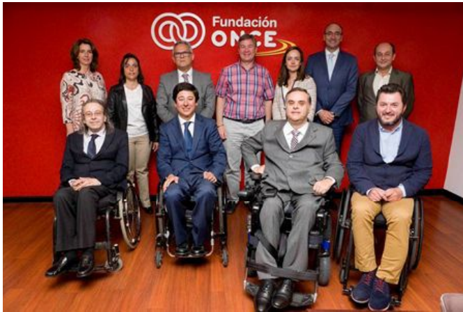
Representantes de distintas entidades que forman parte del Consejo Asesor de Accesibilidad de Fundación ONCE

A principios de mayo nuestra asociación estuvo presente en la #MAW17 (Madrid Accessibility Week) con el tema "Accesibilidad y Globalización". Además de estar de invitados en la moderación de una de las mesas en la jornada de puertas abiertas, participamos con una presentación específica para dar a conocer ASEPAU a los futuros egresados del Máster de Accesibilidad de la Universidad de Jaén.