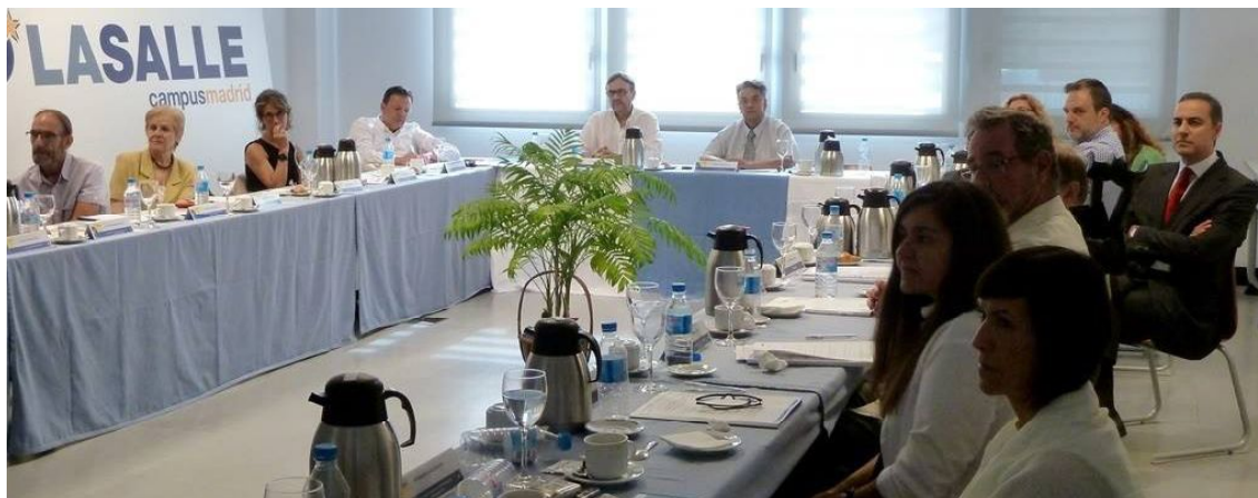
Vista del Comité Consultivo durante la sesión de trabajo

A finales de septiembre se participó en una mesa debate sobre arquitectura hospitalaria, promovida por el Grupo Evetson España, en la que surgieron diversos temas: el diseño de hospitales, la accesibilidad, la diversidad funcional o la necesidad de un compendio de profesionales para hacer un proyecto más completo que vele por la diversidad de la población que va a hacer uso de ese espacio. La Asociación formó parte de la mesa que planteaba la accesibilidad, como representante de los profesionales que trabajan por su implantación y promoción, y cuyo papel se consideró muy importante en esta rama concreta de la arquitectura.