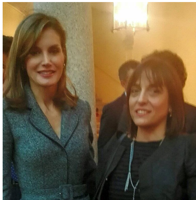
Nuestra presidenta junto a la reina Doña Letizia

En noviembre , los profesionales de la Accesibilidad Universal estuvimos presentes, a través de la presidenta de ASEPAU, en la entrega anual de los Premios Reina Letizia de Accesibilidad que entrega