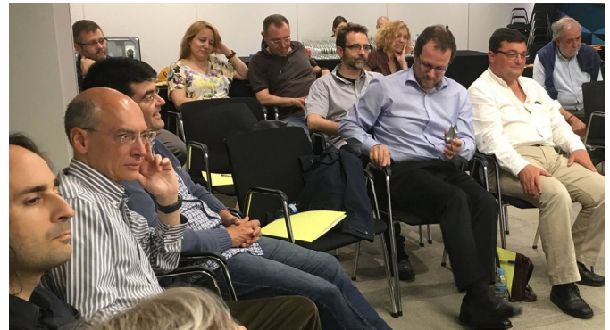
Socios asistentes a la Asamblea General Ordinaria

A principios de mayo nuestra asociación estuvo presente en la #MAW17 (Madrid Accessibility Week) con el tema "Accesibilidad y Globalización". Además de estar de invitados en la moderación de una de las mesas en la jornada de puertas abiertas, participamos con una presentación específica para dar a conocer ASEPAU a los futuros egresados del Máster de Accesibilidad de la Universidad de Jaén.