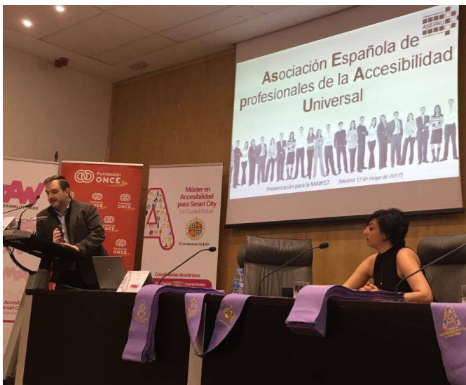
Participación de ASEPAU en la MAW17 (Madrid Accessibility Week)