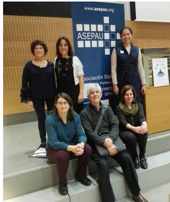
Participación de ASEPAU y varios miembros en la jornada en Pamplona

A finales de octubre, media docena de socios participaron en la jornada de Accesibilidad Universal “Una Mirada Periscópica” organizada por Calícrates en Pamplona. Nuestra presidenta dio a conocer nuestra asociación y animó a todos los profesionales de la Accesibilidad a sumarse a este proyecto. Otros socios de reconocida experiencia compartieron también proyectos desde sus diferentes especialidades en la Accesibilidad.