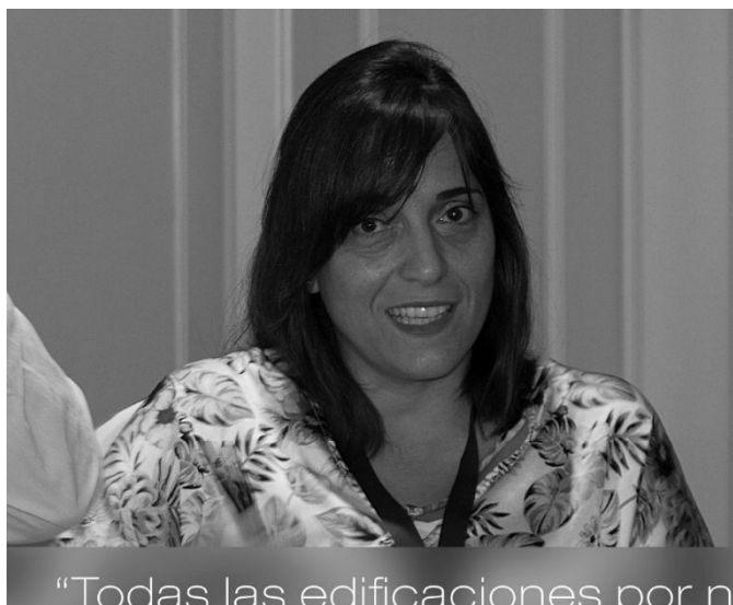
Nuestra presidenta como representante de la Asociación

el Real Patronato de Accesibilidad. Un importante paso que confirma la necesidad de que los profesionales de la Accesibilidad y nuestro trabajo también estemos presente y seamos visibles.