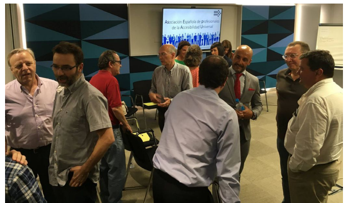
Momento del encuentro SOMOS ASEPAU 2017