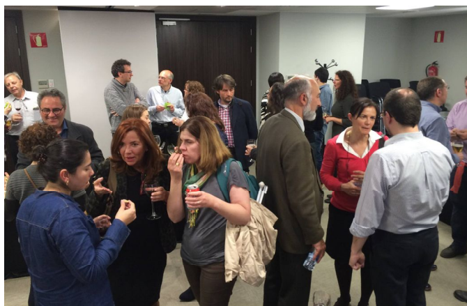
Momento del encuentro "SOMOS ASEPAU" 2016

En el mes de junio contamos con una nueva sesión para socios de nuestras jornadas profesionales "CONVERSACIONES ASEPAU", que nos permitió participar en el debate con diversos profesionales y donde se dieron puntos de vista diferentes. En esta