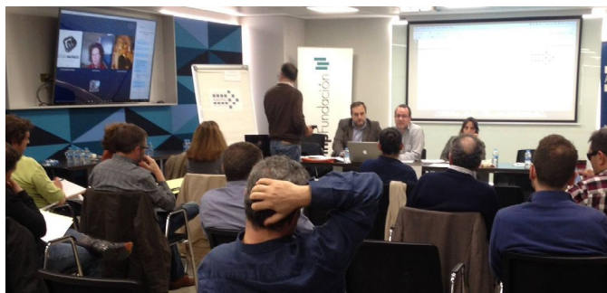
Asamblea General Ordinaria con gran presencia de socios

Comenzamos el recorrido en el año 2016 , en el mes de abril (fecha de la publicación del último número de la revista) con una interesante Asamblea General Ordinaria en la que contamos con gran presencia de socios y el posterior encuentro "SOMOS ASEPAU". Resultó un encuentro distendido e informativo en el que personas interesadas tuvieron la oportunidad de conocer nuestra asociación y a profesionales de la Accesibilidad Universal.