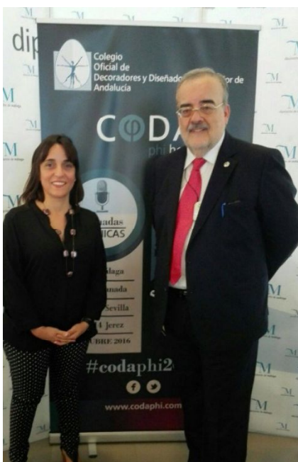
Momento de la presentación del concurso del CODA en Málaga

En el mes de octubre se participó en la presentación del ambicioso concurso de ideas, “CODA PHI Hotel” propuesto por el Colegio Oficial de Decoradores y Diseñadores de Interior de Andalucía (CODA), donde la accesibilidad tuvo un papel relevante. Estuvimos presentes en Málaga, en la presentación y arranque del proyecto, y en ese foro tuvimos la ocasión de presentar formalmente ASEPAU.