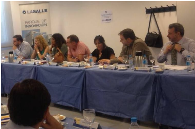
Sesión de trabajo del Comité Consultivo

En esta ocasión, se celebró la 12ª edición donde el tema central fueron las “Smartcities” y dos miembros de nuestra Junta Directiva, representaron a la asociación, aunque es destacable la presencia de otros miembros, representantes de otras entidades, también socios de ASEPAU. Otro paso más para hacernos visibles en las instituciones y eventos sobre Accesibilidad Universal.