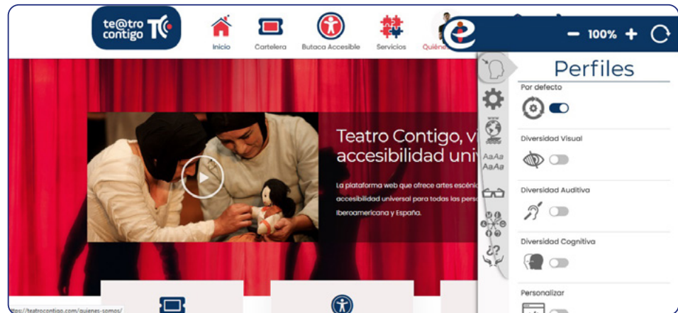
Imagen 1: portada web TeatroContigo.com.

Teatro Contigo demostró que la accesibilidad también es posible en las artes escénicas en línea.