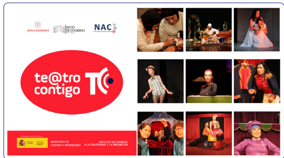
Imagen 2: cartel principal de Teatro Contigo.

El acceso a la cultura no debería depender ni del lugar de residencia ni de las barreras de accesibilidad.