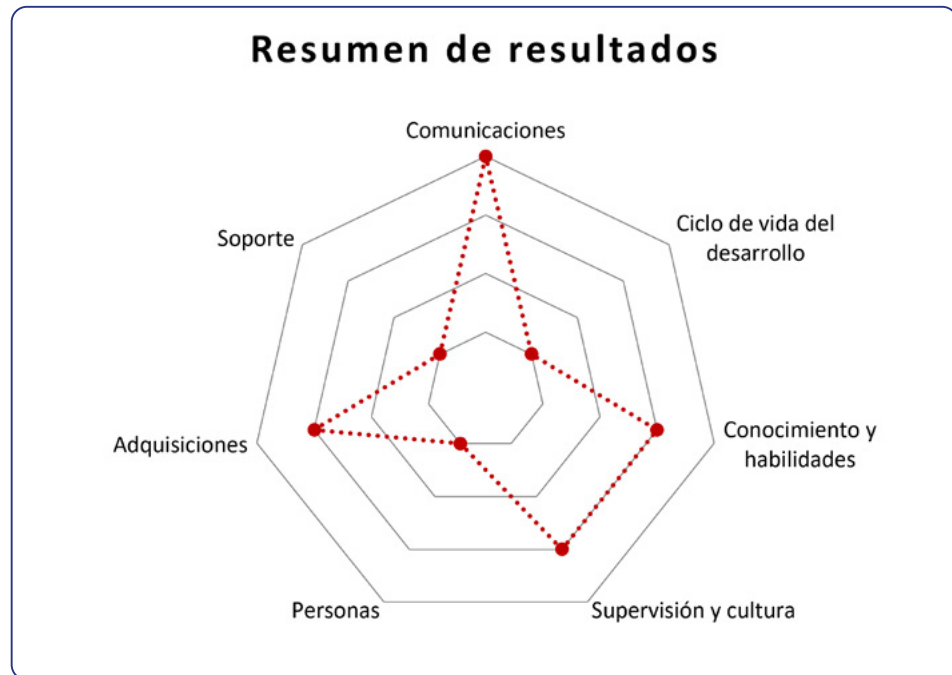
Imagen 2: gráfica resumen de la evaluación de las siete dimensiones en una organización según los cuatro niveles de madurez del modelo. Autor: Olga Carreras Montoto.