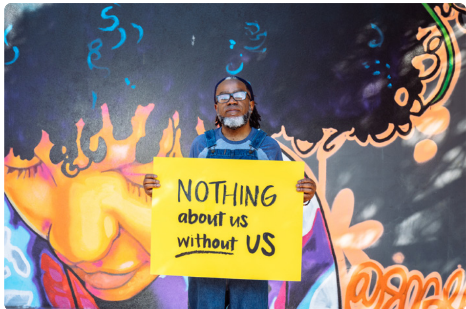
Imagen 3: imagen «Nothing about us without us» («Nada sobre nosotros sin nosotros») de «Disabled and Here» 3 (Licencia CC BY 4.0)

La accesibilidad pierde credibilidad cuando se diseña sin las personas a las que pretende incluir. Si las personas con discapacidad no están presentes en los equipos y en la toma de decisiones, la accesibilidad se queda en un ejercicio teórico.