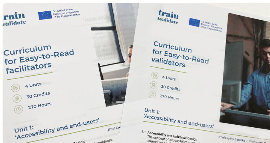
Folleto de difusión de los planes de estudios para dinamizadores y validadores de lectura fácil.

En primer lugar, la creación de un currículo metodológico y pedagógico. En coherencia con el desarrollo de las tablas de competencias, el plan debería estar basado en competencias, frente al modelo tradicional más basado en la figura del formador o profesor. Para ello, se tomó como referencia la propuesta del pedagogo belga Louis D'Hainaut, que estructuraba el currículo en tres niveles: metas y objetivos, métodos de enseñanza y herramientas, y métodos de evaluación y herramientas. Estos tres niveles se subdividen, a su vez, en 14 subcategorías en total, en torno a las cuales se definió cómo se debía proceder para el caso de Train2Validate. Las categorías y subcategorías metodológicas y pedagógicas inciden, principalmente, en cómo abordar el carácter práctico de las materias y propone herramientas para el estudio, la enseñanza y la evaluación, con especial énfasis en las particularidades didácticas que hay que tener en cuenta en el caso de los validadores, por ser personas con dificultades de comprensión. De forma resumida, los principales aspectos del currículo metodológico y pedagógico fueron: